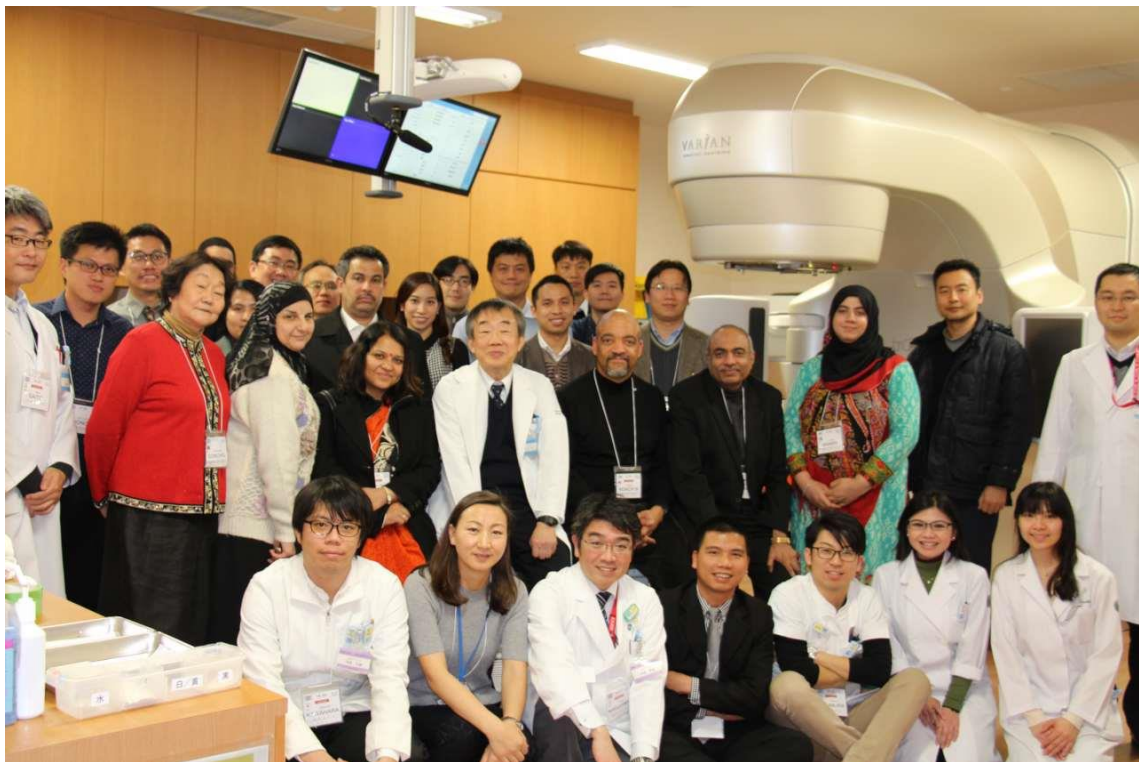
広島大学病院にて