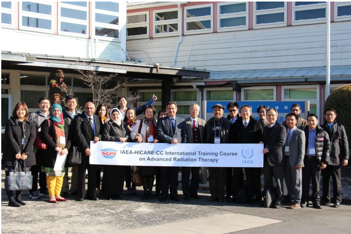
放射線影響研究所にて