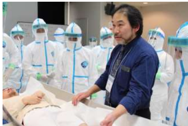
京都大学救急専門医森氏による実習指導