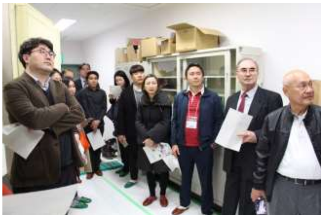
広島大学病院 施設見学の様子