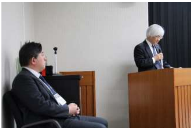
広島大学副学長 神谷教授による挨拶