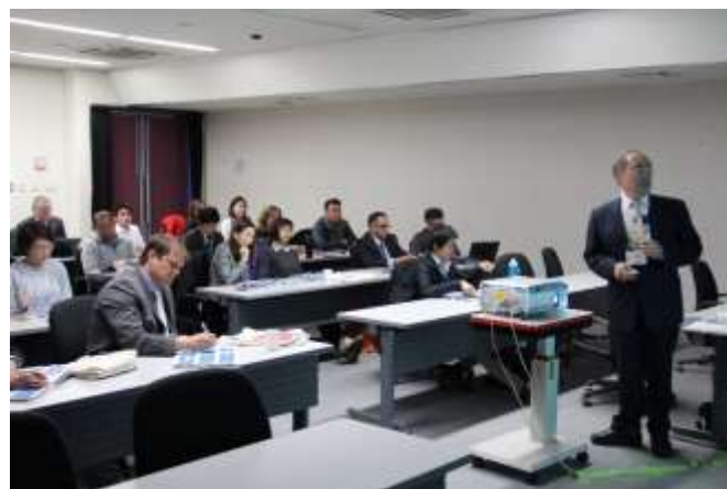
ツライ准教授による講義